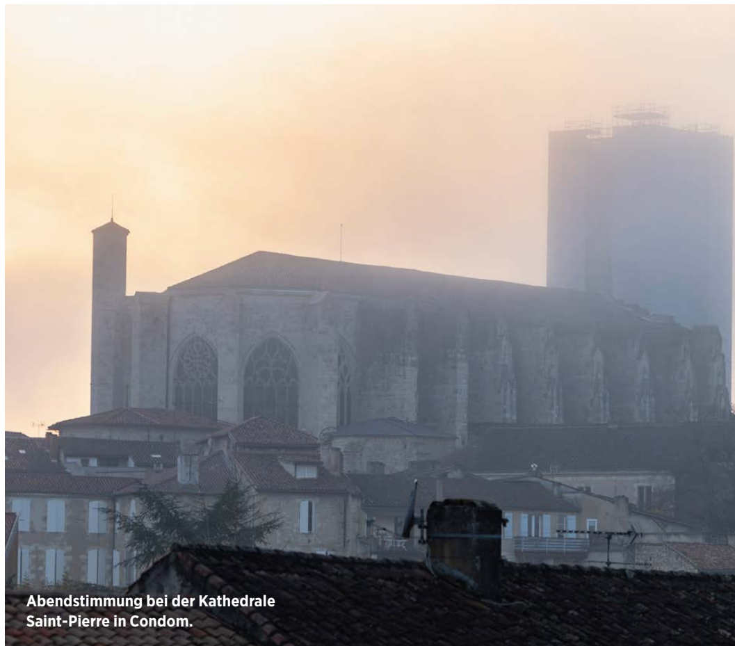
Abendstimmung bei der Kathedrale Saint-Pierre in Condom.

Eine Besonderheit ist zudem die Kategorie der nicht fassgelagerten «Blanche Armagnac». Diese AOC existiert erst seit 2005 und ist ein faszinierendes Bindeglied zwischen den Weinen und den Armagnacs, die in der Barrique ausgebaut wurden. Diese Destillate können sich nicht hinter dem Holz verstecken, das ih-