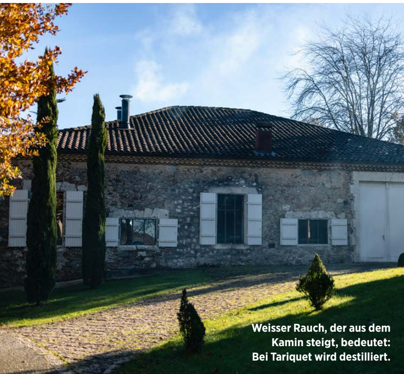
Weisser Rauch, der aus dem Kamin steigt, bedeutet: Bei Tariquet wird destilliert.