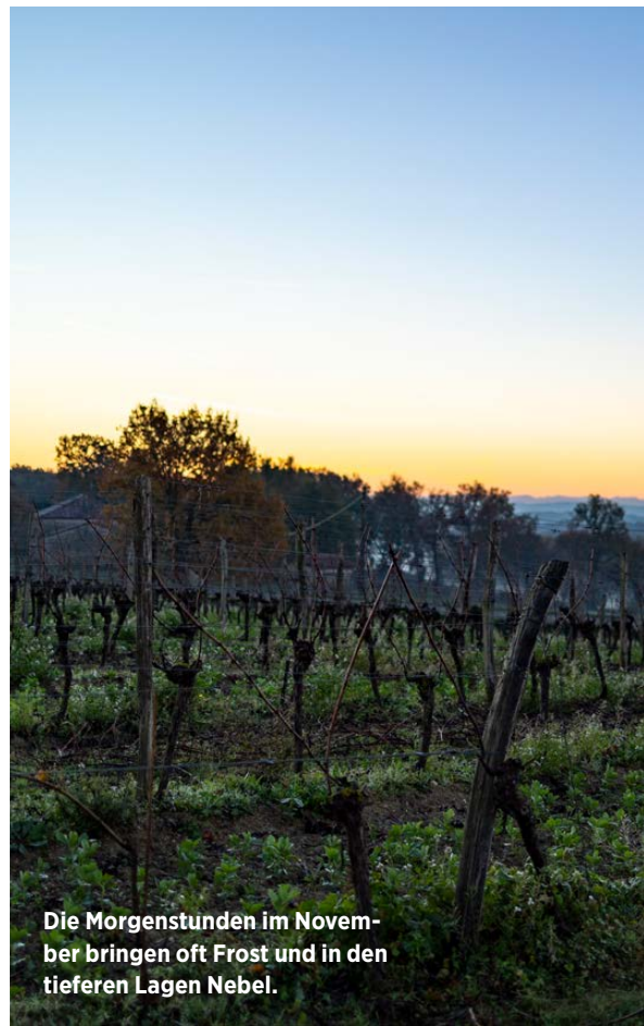
Die Morgenstunden im November bringen oft Frost und in den tieferen Lagen Nebel.

Seit Oktober 2024 muss beim Export von europäischen Weinbränden eine Kautions von