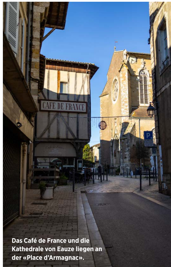
Das Café de France und die Kathedrale von Eauze liegen an der «Place d'Armagnac».