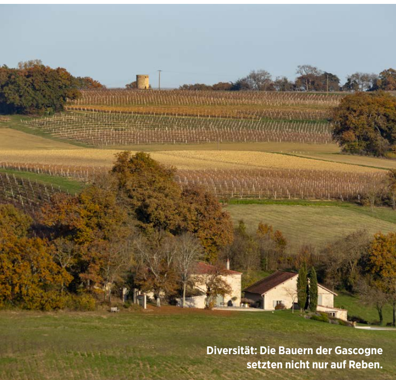
Diversität: Die Bauern der Gascogne setzen nicht nur auf Reben.