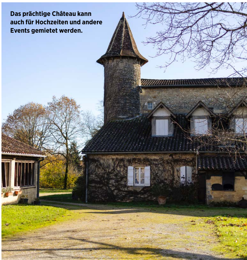
Das prächtige Château kann auch für Hochzeiten und andere Events gemietet werden.