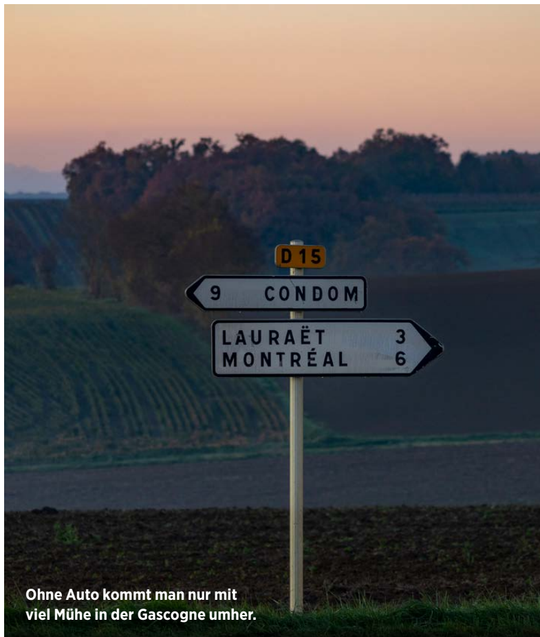
Ohne Auto kommt man nur mit viel Mühe in der Gascogne umher.