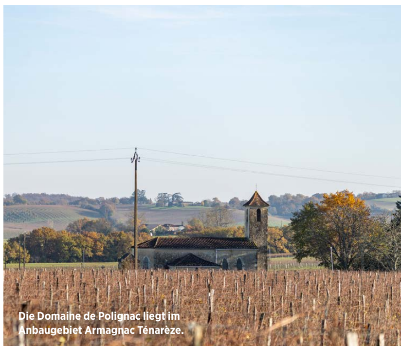
Die Domaine de Polignac liegt im Anbaugebiet Armagnac Ténarèze.